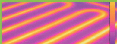
Verifica dispersione dell'impianto di riscaldamento