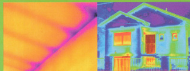
Individuazioni ponti termici

Studio Tecnico Associato Pro.Geo. Via Fiume n°8 - 13040 - Saluggia